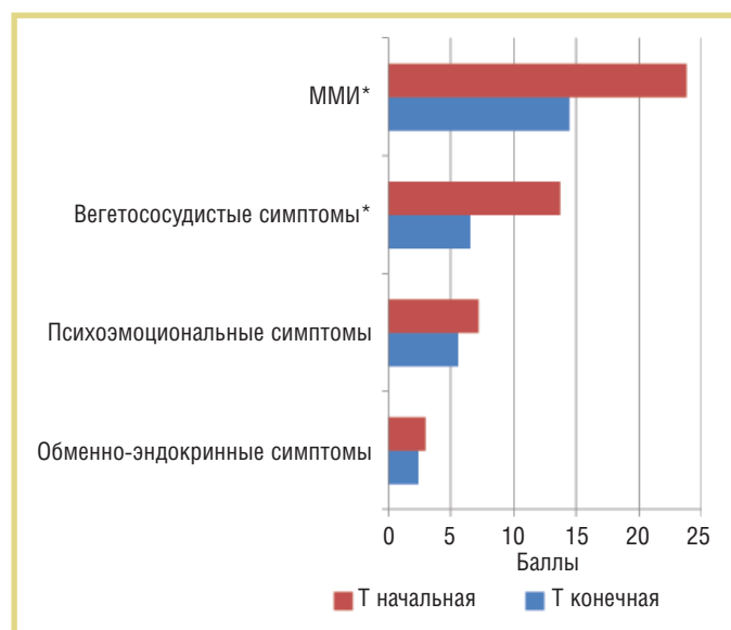
Рис. 1. Изменение ММИ и его компонентов на фоне терапии МТ пролонгированного действия; здесь и на рис. 2: Т – точка исследования; * – p < 0,05

Положительное действие МТ на самочувствие женщин в перименопаузе с климактерическим синдромом подтверждено в ряде зарубежных и отечественных работ. Некоторые исследователи предлагают использовать препараты МТ как первую ступень лечения климактерических расстройств еще до начала менопаузальной гормональной терапии (МГТ) [6].